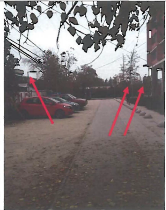
Fotografía N°1: Fecha 20/05/2014. Imagen: Postes de luminarias de 4 metros. Observación: Postes instalados no corresponden a los especificados de 8 metros.