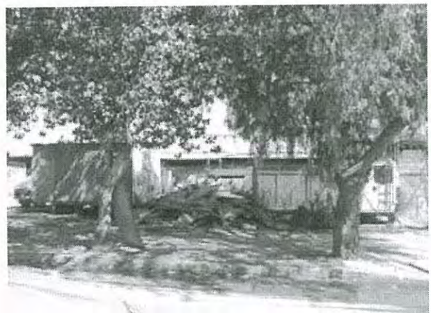
"Plaza Activa" no intervenida, La Pintana.