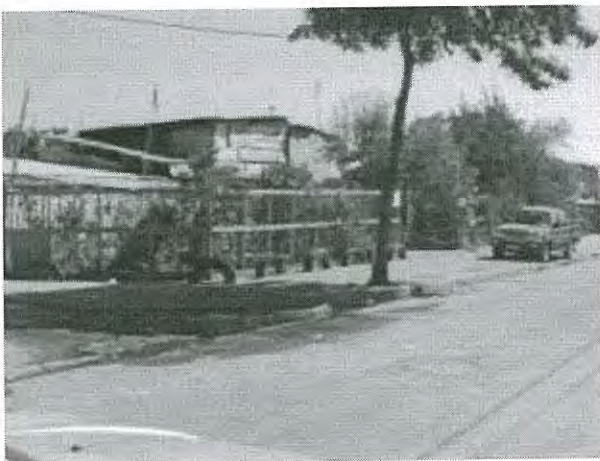
"Plaza Rayuela" no intervenida, La Pintana.

Cabe precisar que a la fecha de la visita practicada por esta Contraloría General no se habían iniciado las obras correspondientes a las plazas "Rayuela" y "Activa", por encontrarse ocupadas por pobladores.